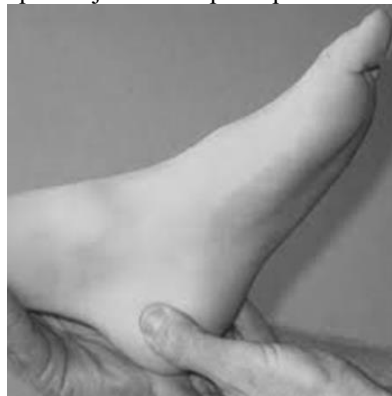
Gambar 2. Calcaneal Squeeze Test

Interpretasi: Tes dinyatakan positif jika saat diperas pasien merasa nyeri (Latt, 2020).