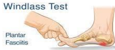
Gambar 1. Windlass Test